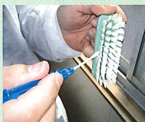
爪ブラシの拭取り検査